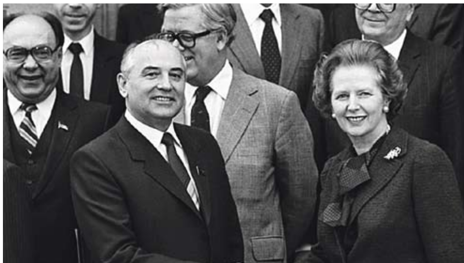
В ноябре 1991 года экс-премьер-министр Великобритании Маргарет Тэтчер выступила с речью в Хьюстоне, США, в которой рассказала, как именно Великобритания и другие западные страны разрушали СССР. Также в своей ноябрьской речи она поведала о скором юридически закреплённом развале СССР. И действительно, через несколько недель, как по мановению волшебной палочки британского премьера, в декабре 1991-го были подписаны Беловежские соглашения

Так воспринимают прошедшее после Беловежских соглашений 8 декабря 1991 года время многие ученые, журналисты, представители общественных и политических организаций в поисках корней произошедшего